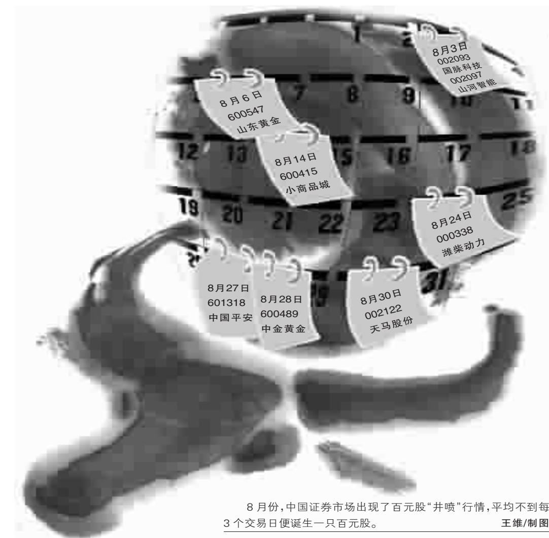
8月份,中国证券市场出现了百元股“井喷”行情,平均不到每3个交易日便诞生一只百元股。 王维/制图